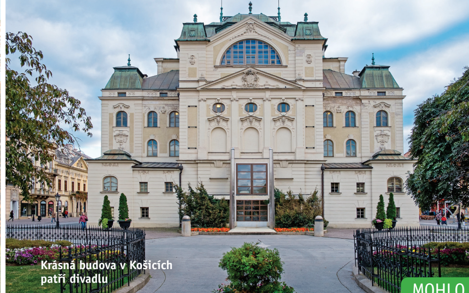
Krásná budova v Košicích patří divadlu