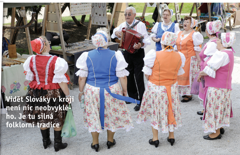
Vidět Slovákky v kroji není nic neobvyklého. Je tu silná folklorní tradice

P atíte-li mezi vyznavače aktivního odpočinku, na Slovensku nemůžete být zklamáni. Dáváte přednost pohodové turistice nebo s sebou berete děti? Ve Slovenském ráji najdete mnoho krásných turistických a cyklistických stezek. Touláte-li se raději drsnější přírodou, zamiřte do Roháčů, které jsou nejkrásnější a nejpřitažlivější částí Západních Tater. I zde si můžete vybrat naprosto pohodové ale i náročné stezky. Totéž samozřejmě