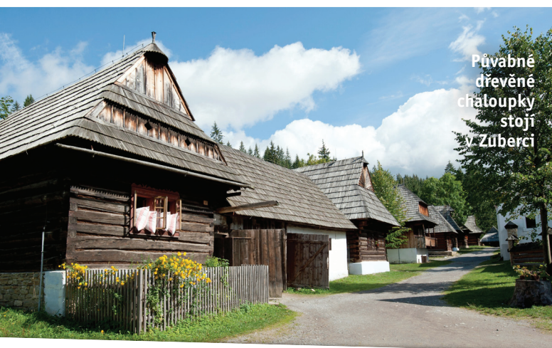
Půvabné dřevěné chatoučky stojí v Zúberci

Kamzík horský tatranský je poddruh kamzíka, kterého potkáte pouze v Tatrách. Je i na logu Tatranského národního parku.