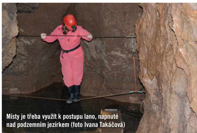
Místy je třeba využít k postupu lano, napnuté nad podzemním jezírkem

Na Zemplíně se zachovala řada technických památek a unikátních staveb lidové architektury. Zajímavé jsou kamenné klenuté můstky v Trnavě na Laborci, bývalé vodní mlýny v Hnojnom, Nižné Rybnici a Rusovciach nebo zbytky úzkokolejky v Remetských Hámroch. Dřevěný kostelík z první poloviny 18. století v Ruské Bystré, který je jedním