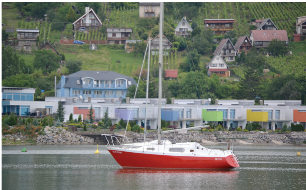
Na jaře Zemplínská Širava své hosty teprve čeká

z osmi podobných na Slovensku pod ochranou UNESCO, jsme navštívili při naší minulé návštěvě (Cykloturistika 7–8/2010).