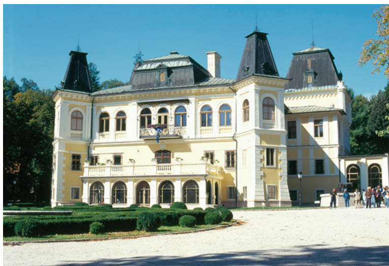
Na hrady a zámky narazíte v kraji na každém kroku, za návštěvu stojí zámek Betliar