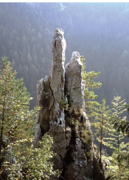
Příroda východního Slovenska zůstává místy divoká, zvláště ve Slovenském krasu a Slovenském ráji. Ihla v Prielomu Hornádu.