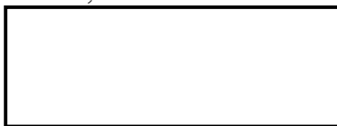
Košice Región Turizmus predseda