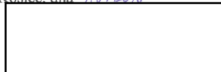
ART FILM FEST s.r.o štatutár