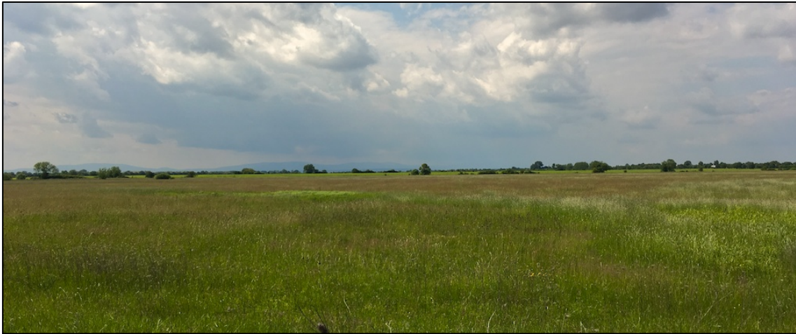
Praderas húmedas en Senianske rybníky (región de Košice)

El trayecto entre el pueblo de Iňačovce y la primera laguna, transcurre entre campos de cultivo y praderas húmedas, con buenos setos de arbustos espinosos y manchas de árboles de ribera. Vemos y/o escuchamos en este hábitat Curruca gavilana ( Sylvia nisoria ), Carriceros políglotas ( Acrocephalus palustris ) y Carricines comunes ( A. schoenobaenus ), Currucas zarceras ( Sylvia communis ) y zarcerillas ( S. curruca ), un Zarcero icterino ( Hippolais icterina ) y un Águila pomerana ( Clanga pomarina ) en vuelo, además de otras aves más comunes.