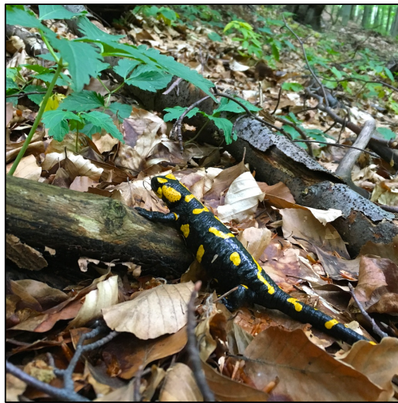
Salamandra común ( Salamandra salamandra )