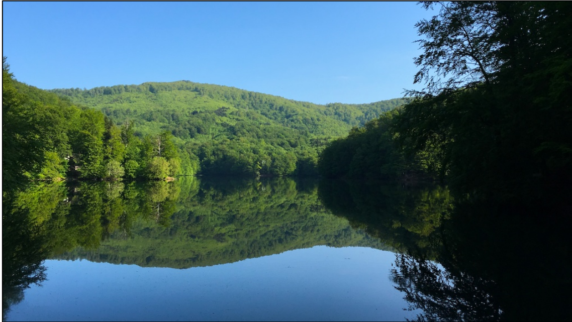
Lago volcánico natural "The eye of the Sea" en las montañas Vihorlat.

aunque por muy pocos segundos antes de desaparecer de nuevo en la espesura del follaje de las hayas.