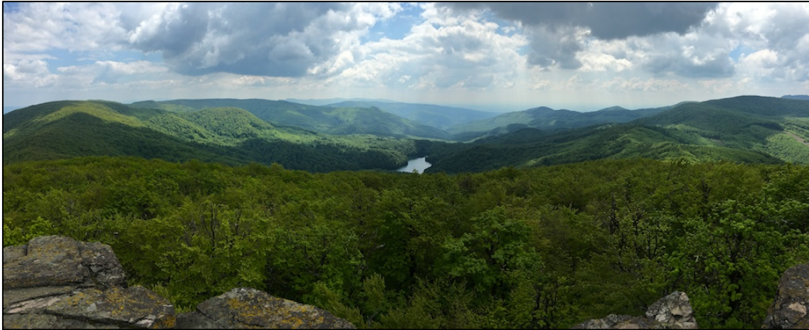
Panorámica de las montañas Vihorlat (Cárpatos orientales) desde el pico Sninský kameň (1006 msnm)