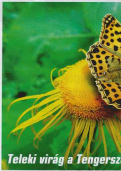
Teleki virág a Tengerszem-tó