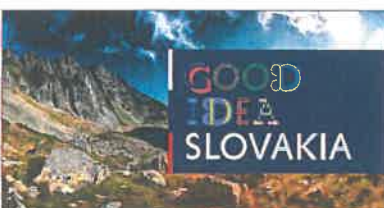
Aplikácia logotypu na fotografickom podklade Application of the logotype on photographic background