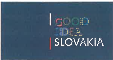
Aplikácia logotypu na podklade predpísanej modrej farby Application of the logotype on the background with prescribed blue colour