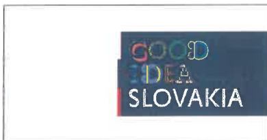
Aplikácia logotypu na bielom podklade Application of the logotype on white background