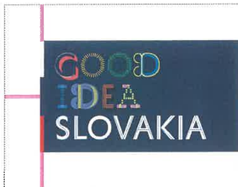
The minimum protection zone at the preferred placement of the logotype to the right edge of the format

Minimálna ochranná zóna pri preferovanom osadení logotypu k pravému okraju formátu