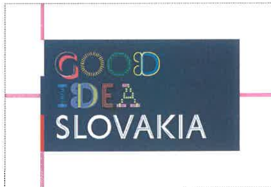
The minimum protection zone when the logotype is applied freely in area of the format

Minimálna ochranná zóna pri aplikácii logotypu voľne do priestoru formátu