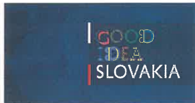
Aplikácia logotypu na podklade s textúrou Application of the logotype on the background with texture