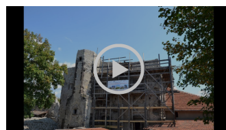
Stredoveký šliapací žeriav na Vinianskom hrade