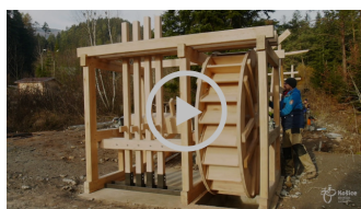
Banský pochwerk v Gelnici